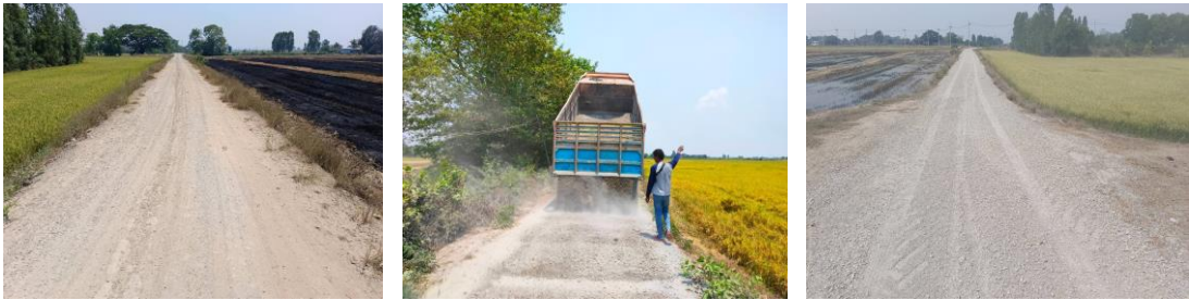
๑๖. โครงการลงหินคลุก หมู่ที่ ๔ จากถนนข้าง ร.ร วัดกระทุ่มทอง ถึง รพ.สต.บ้านสามัคคีธรรม