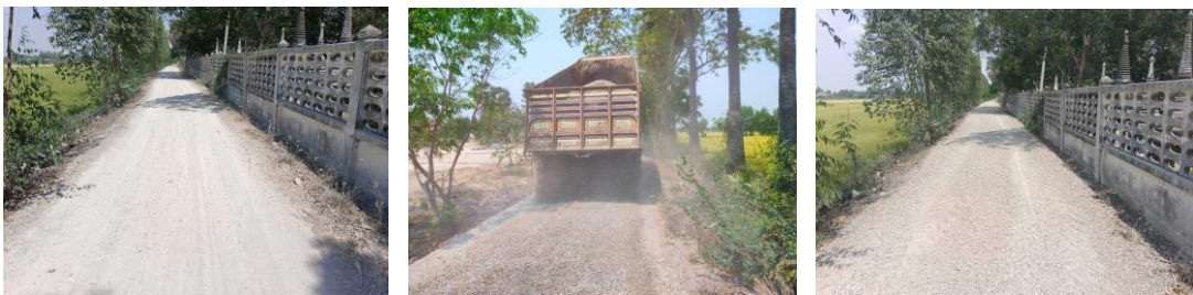
๑๗. โครงการลงหินคลุกเพื่อกลบหลุมบ่อถนน หมู่ที่ ๑