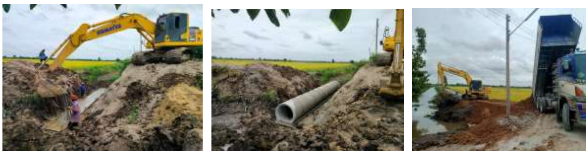
๒๓.โครงการท่อระบายน้ำ ค.ส.ล. ปากลิ้นราง Ø ๑.๐๐ เมตร หมู่ที่ ๑ บริเวณบ้านนายอนันต์ เพชรเว้า