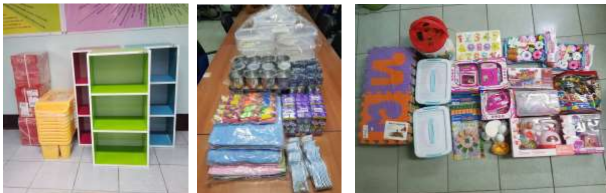
๙. โครงการสนับสนุนค่าใช้จ่ายการบริหารสถานศึกษา (ค่าใช้จ่ายในการจัดการศึกษา)