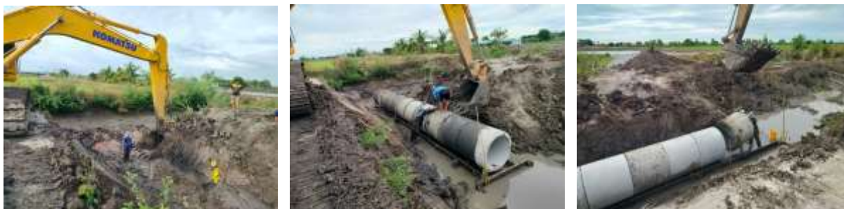
๒๒.โครงการวางท่อระบายน้ำ ค.ส.ล. ปากลิ้นราง Ø ๑.๐๐ เมตร หมู่ที่ ๑ บริเวณนายศิริราช อุทัยฉาย