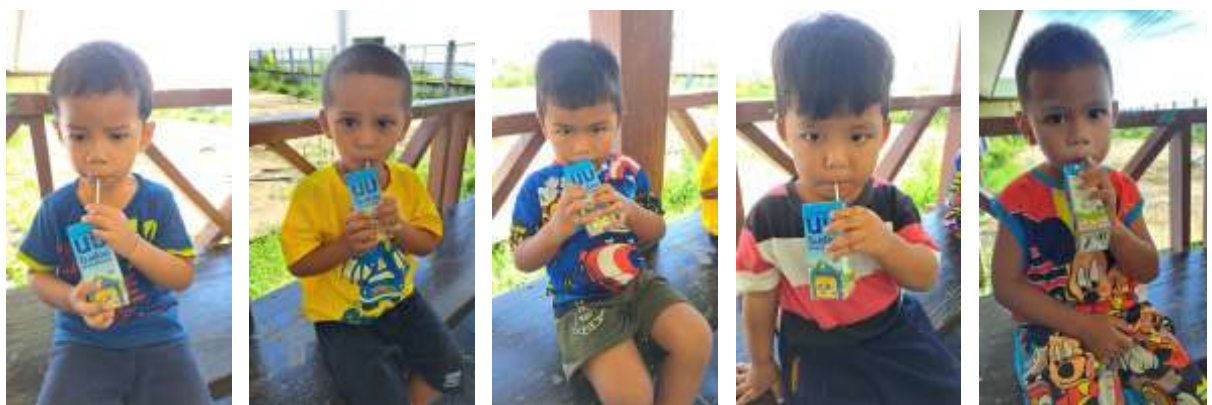
๑๒. โครงการอุดหนุนส่วนราชการโครงการสนับสนุนค่าใช้จ่ายการบริหารสถานศึกษา (อาหารกลางวัน)