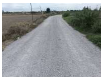
๒๘. โครงการลงหินคลุกเพื่อกลบหลุมบ่อถนน หมู่ที่ ๖ จากบ่อกึ่งนายกิตติพงษ์ สีบนิคม ถึงบ่อกึ่งนางน้อม พุทธจรรยา